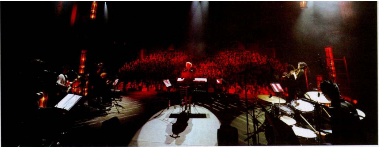
מחברת לבבות. אודהליה על הבמה.

לאכול. כל סדרי העדיפויות השתנו לגמרי. את הלימוד של הקורונה אנחנו נלמד, אני רק מאחלת שזה יהיה בחסד וברחמים".