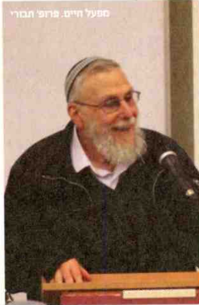
מפעל חיים. פרופ' תבורי

היום בוודאות גמורה שכל כתבי היד, כל עמוד של כתב יד – יש בו טעויות. זה עניין סטטיסטי מוכח, וכאחד שעבר על אלפי כתבי יד עוד לא מצאתי עמוד אחד שאין בו טעויות. ישנם שיבושים והשמטות, וכי שהדפיסו את הדפוסים הסתמכו על כתבי היד בלי להשוות בין הנוסחים. ולכן יש בזה הרבה טעויות. מחקר התלמוד והמדרשים עוסקים הרבה מאוד בהדרה של הטקסטים האלה. להכין מהדורה מדעית זה למעשה לאסוף כתבי יד עתיקים מרחבי העולם, וליישם עקרונות מחקריים על מנת לאבחן ולשחזר את הטקסט המדויק ביותר.”