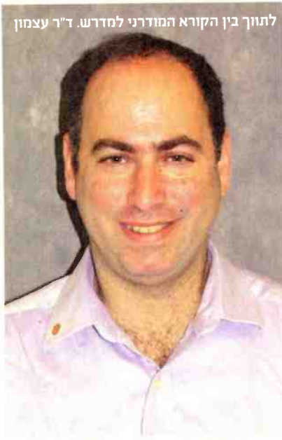
לתוך בין הקורא המודרני למדרש. ד"ר עצמון