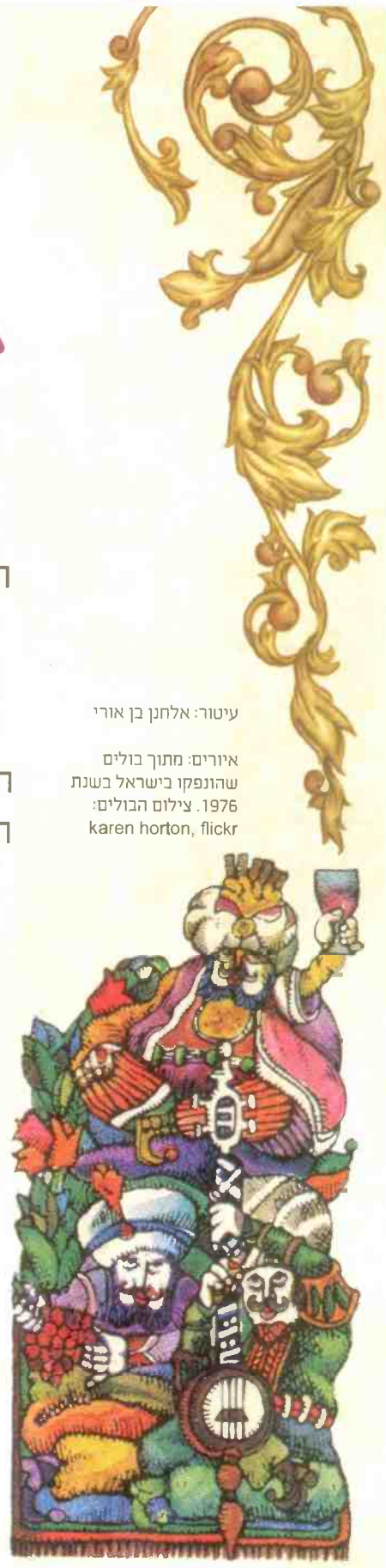
איורים: מתוך בולים שהונפקו בישראל בשנת 1976.