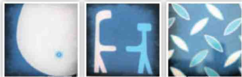
מימין: "עיר לא נעזבה", "ידידות" ו"טבור הארץ"

ירושלים מעברים, מגדל דוד - המוזיאון לתולדות ירושלים במוסגרת The Jerusalem Biennale: הביאנלה של ירושלים לאמנות יהודית עכשווית. הנעילה: 5.11