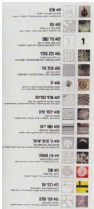
המקרא. גם חלק מהיצירה

"בעיני דווקא ההתמקדות בתשתית יוצרת מנה משותף בין השכונות השונות, מבוססות כמוזנחות, דתיות כחילונית, ערביות כיהודיות - כולן תלויות בשירותים העירוניים הבסיסיים כדי לתפקד. חוץ מזה אני לא הראשון שעשה את זה, ובעיניי